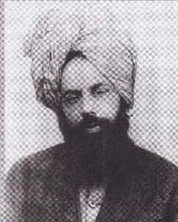
ஹஸ்ரத் மிர்ஸா குலாம் அஹ்மத் வாக்களிக் கப்பட்ட மஹ்தி மஸ்ஹ் (அலை) (1835-1908)

(1908 ம் ஆண்டு மே மாதம் 27 ம் திகத் அஹ்மதிய்யா முஸ்லிம் ஜமாஅத்தின் ஸ்தாபகர் ஹஸ்ரத் மிர்ஸா குலாம் அஹ்மத் (அலை) அவர்களின் மறைவுக்குப் பின்னர் இறை வாக்குறுதியின் அடிப்படையில் அஹ்மதிய்யா ஜமாஅத்தில் கிலாஃபத் எனும் ஆன்மீகத் தலைமைத்துவம் நிருவப்பட்டது)