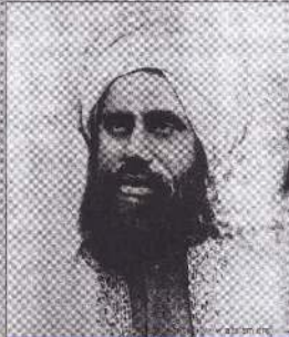
முதலாவது கல்ஃபுதல் மஸ்ஹ் ஹஸ்ரத் மஸ்லானா ஹக்ம் நூருத்தீன் (ரஹ்) (1908-1914)