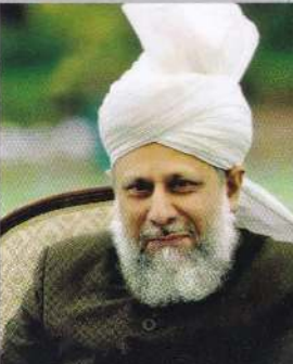
அஹ்மதிய்யா முஸ்லிம் ஜமாஅத்தின் தற்போதைய உலகளாவியத் தலைவர் ஹஸ்ரத் மிர்ஸா மஸ்ரூர் அஹ்மத் (அ.பி.அ) அவர்கள்