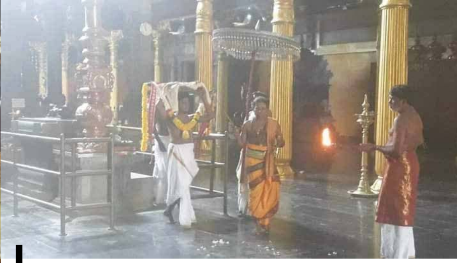
வரலாற்றுச் சிறப்பு மிக்க மானிப்பாய் மருதடி விநாயகர் ஆலய வருடாந்த மகோற் சவம் நேற்று ஞாயிற்றுக்கிழமை அமைதியான முறையில் கொடியேற்றத்துடன் ஆரம்பமானது. (ஐ)