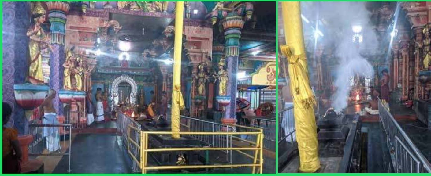
கொரோனாவின் கோர்ப்பிடியில் இருந்து மக்களைக் காப்பாற்ற வேண்டி நயினாதீவு ஆலயத்தில் விசேட வழிபாடு இடம்பெற்றது. சிறப்புப் பூஜை வழிபாடு மற்றும் யாக பூசையும் நடைபெற்றது. இதில் நிர்வாக சபை உறுப்பினர்கள் கலந்து கொண்டனர். (ப-7)