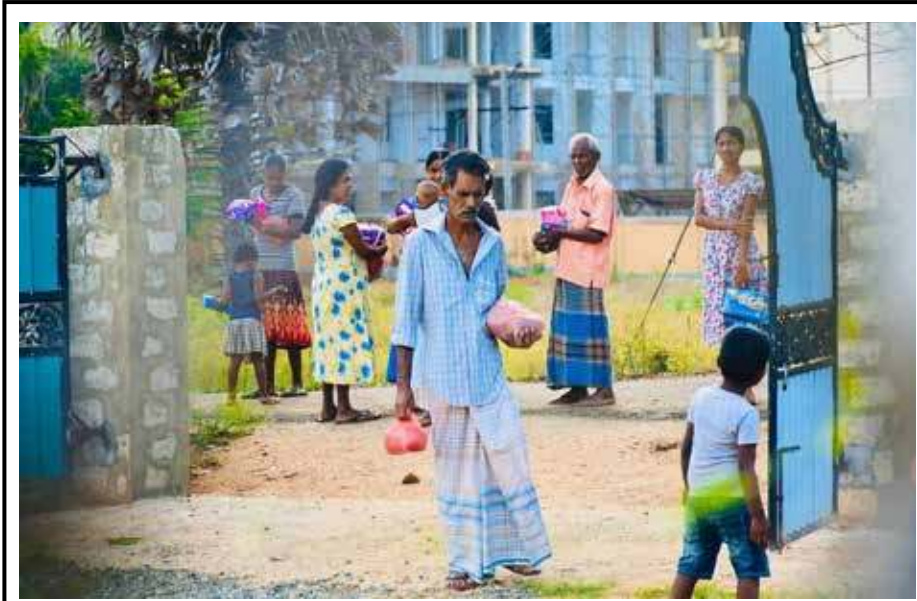
நாட்டின் அசாதாரண சூழ்நிலை கருதி ஜே.கே.எஸ். பவுண்டேசன் அமைப்பின் சார்பாக வடமாகாணம் முழுவதும் 400க்கும் மேற்பட்ட குடும்பங்களுக்கு உலர் உணவுப் பொருள்கள் வழங்கப்பட்டு வருகின்றன. (ம-222)

கொரோனா உணரடங்கு உத்தரவால் பாதிக்கப்பட்டுள்ள வறுமைக்கு உட்பட்ட மாணவர்களின் குடும்பங்களுக்கு உணவுப் பொதிகள் உள்ளிட்ட வற்றை வழங்குவதற்காகவே இந்த நிதி கையளிக்கப்பட்டுள்ளதாகத் தெரிவிக்கப்பட்டுள்ளது. (ம-159)