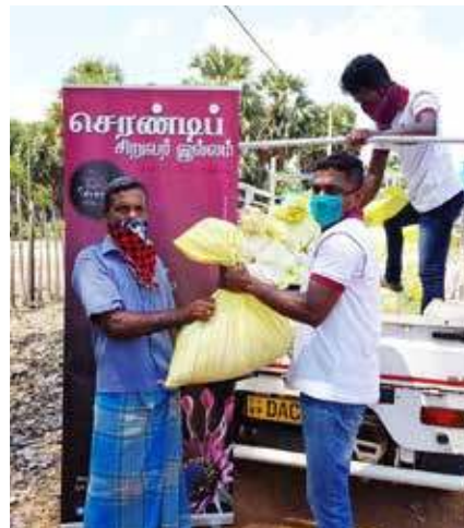
ஓம் சக்தி அம்மா காப்பகத்தின் நிதியிலிருந்து வழங்கப்பட்ட நிதியினைக் கொண்டு செரண்டிப் சிறுவர் இல்லத்தினூடாக முல்லைத்தீவு கரைதுறைப்பற்று பிரதேச செயலர் பிரிவினா உள்ள வற்றாப்பளை, கருநாட்டுக்கேணி, கொக்கிளாய் மேற்கு, கொக்கிளாய் கிழக்கு ஆகிய கிராம அலுவலர் பிரிவுகளில் உள்ள குடும்பங்களுக்கு உலர் உணவுப் பொதிகள் நேற்றுமுன்தினம் வழங்கப்பட்டன. (ம-159)

கல்வி பொருளாதார அபிவிருத்தி அமைப்பின் அனுசரணையுடன், இணுவில் மேற்குப் பிரதேசத்தில் கொரோனா தொற்று நோய் எதிர்ப்பு நடவடிக்கைகள் காரணமாக பாதிக்கப்பட்ட 55 தொழிலாளர்களுக்கு உணவுப்பொருட்கள் வழங்கப்பட்டன. (ம-222)