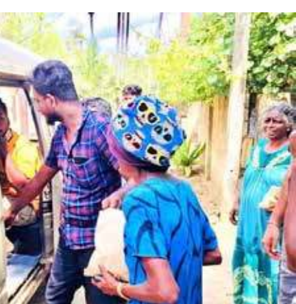
ஜடாயு தன்னார்வ அமைப்பின் ஏற்பாட்டில், சங்கானை பிரதேச இளைஞர் சம்மேளனத்தின் வழிகாட்டலில் நிவாரணப்பணிகள் தற்போது நடைபெற்று வருகின்றன. மரக்கறிப் பொதிகளை அந்த அமைப்பு வழங்கி வருகின்றது. (ம-7)