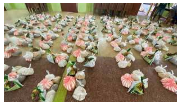
கொரோனாத் தொற்றைத் தவிர்ப்பதற்காக ஏற்படுத்தப்பட்டு உணரடங்கால் பாதிக்கப்பட்டுள்ள 150 குடும்பங்களுக்கு, கலட்டி அம்மன் இளைஞர் கழகத்தால் உலர் உணவுப் பொதிகள் வழங்கப்பட்டன. (ம)

ஆகிய இடங்களில் தற்போதைய இடர்காலத்தில் தமது ஜீவனோபாயத்தை மேற்கொள்ள முடியாது தவித்துவந்த பெண்தலைமைத்துவக் குடும்பங்கள், ஆதரவற்ற முதியோர் குடும்பம் என தெரிவு செய்யப்பட்ட குடும்பங்களுக்கு தலா 3 ஆயிரம் ரூபா பெறுமதியான உலருணவுப் பொதிகள் வழங்கப்பட்டன. (ம)