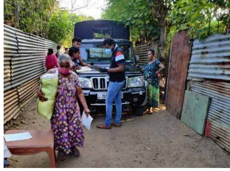
கொரோனா ஊரடங்கால் பெருமளவான மக்கள் பாதிக்கப்பட்டுள்ள நிலையில், யாழ்ப்பாணம் நாவலர் வீதியில் அமைந்துள்ள முகாமில் வசிக்கும் 26 குடும்பங்களுக்கு உலர் உணவுப் பொதிகள் வழங்கப்பட்டன. லண்டன் கனக தூர்க்கை அம்மன் ஆலயத்தினரின் உதவியுடன் இந்த உணவுப் பொதிகள் வழங்கப்பட்டன. (ம)