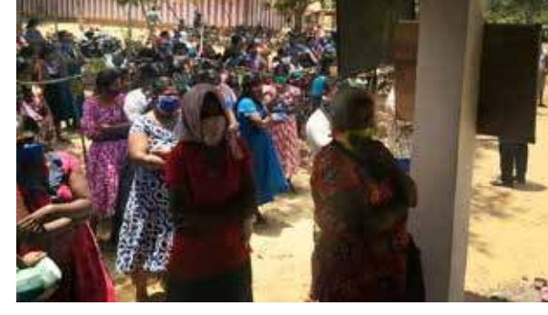
கொரோனா தடுப்பு நடவடிக்கையால் பாதிக்கப்பட்டுள்ள மக்களுக்கு 'கிறீஸ் பியூச்சர் நேசன் பவுண்டேசன்' அமைப்பால் உதவித் திட்டங்கள் வழங்கப்பட்டு வருகின்றது. கிரீநொச்சி மாவட்டம் புதுமுறிப்புக் கிராமத்தில் வசிக்கின்ற மிகவும் வறுமைக்கோட்டுக்கு உட்பட்ட 55 குடும்பங்களுக்கு அத்தியாவசியப் பொருட்கள் அடங்கிய உலர் உணவுப் பொதிகள் பிரான்ஸ் வாழ்தமிழ் மக்களின் உதவியுடன் அண்மையில் வழங்கப்பட்டது. (ம)