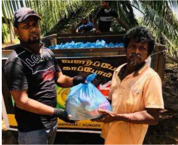
யாழ்ப்பாணம் கல்வியங்காடு நல்லூர் நண்பர்கள், லண்டன் இளைஞர்கள் இணைந்து முல்லைத்தீவு ஒட்டுசுட்டான் பிரதேச செயலர் பிரிவின் கீழ் உள்ள பண்டாரக்குளம் கிராமத்தில் வசித்து வரும் இருபது குடும்பங்களுக்கு உலர் உணவுப்பொதிகளை நேற்று வழங்கினர். (ம-222)