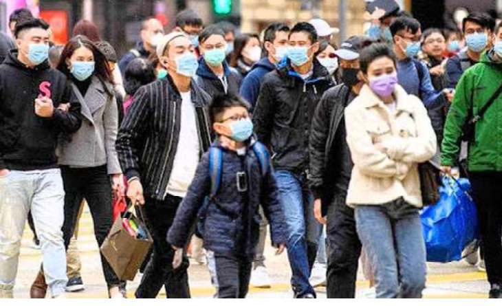
(ஜெனிவா) கொரோனா வைரஸ் க்கு ஐரோப்பாவில் பலியானவர்கள்

எண்ணிக்கை 75 ஆயிரத்தைக் கடந்தது. இதில் 80 சதவீதத்தினர் இத்தாலி, ஸ்பெயின், பிரான்ஸ்.