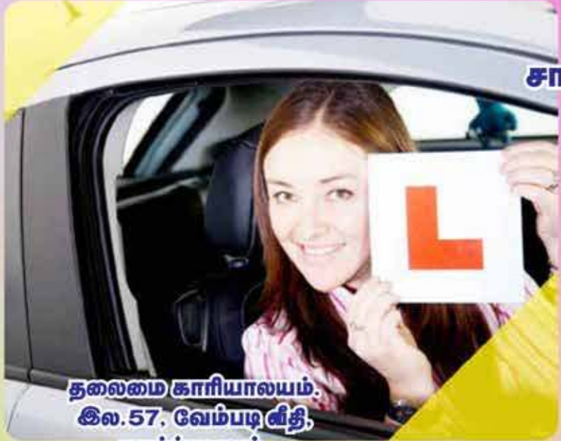
தலைமை காரியாலயம். இல.57, வேம்படி வீதி, யாழ்ப்பாணம்.

முறையான சாரத்தியத்தைக் கற்றுக் கொள்ள எம்முடன் இணைந்து கொள்ளுங்கள்.