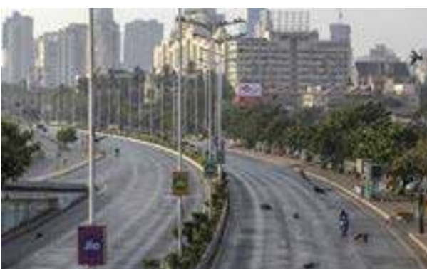
டுத்து நோய்த்தொற்று உறுதி செய்யப்படுவதால் கடந்த சில நாட்களாக பாதிக்கப்பட்டவர்களின் எண்ணிக்கை

அதிகரித்துக் கொண்டே வருகிறது. இந்நிலையில், இந்தியாவில் கொரோனா தொற்றால் பாதிப்பு அடைந்தோர் 35 ஆயிரத்தை தாண்டியுள்ளது என மத்திய சுகாதாரத் துறை தெரிவித்துள்ளது. இதுதொடர்பாக, மத்திய சுகாதாரத்துறை வெளியிட்ட டுள்ள செய்தியில் - இந்தியாவில் கொரோனா தொற்று உறுதி செய்யப்பட்டவர்களின் எண்ணிக்கை தற்போதைய நிலவரப்படி 35 ஆயிரத்து 365 ஆக அதிகரித்துள்ளது. மேலும், கொரோனா வைரஸ் பாதிப்பில் இருந்து குணமடைந்தோர் எண்ணிக்கை 9,064 ஆக உள்ளது. அதேபோல், கொரோனா பாதிப்பால் பலியானோர் எண்ணிக்கை 1,152 ஆக உயர்ந்துள்ளது. கொரோனா பிடிபில் மகாராஷ்டிரா மகாராஷ்டிராவில் நேற்று ஒரே நாளில் 1,008 பேருக்கு கொரோனா இருப்பது பரிசோதனையில் உறுதி செய்யப்பட்டுள்ளது. இதன் மூலம் மாநிலம் முழுவதும் இதுவரை பாதிக்கப்பட்டவர்களின் எண்ணிக்கை 11,506 ஆக அதிகரித்துள்ளது. கொரோனா தொற்றுக்கு நேற்று மட்டும் 26 பேர் உட்பட இதுவரை 485 பேர் உயிரிழந்துள்ளனர்.