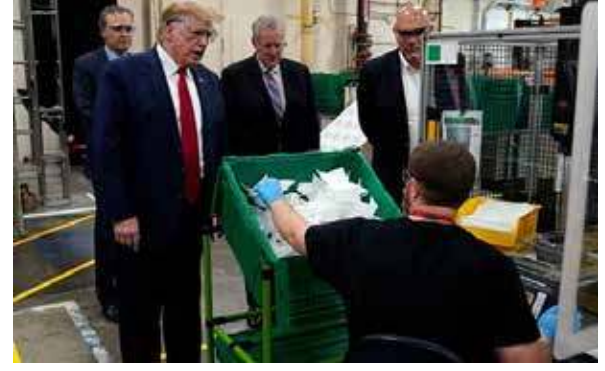
ஆசிய நாடுகளுக்கு அமெரிக்கா உதவுவதாகவும் டரம்ப் கூறினார்