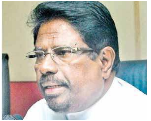
தேர்தல் ஒத்திவைக்கப்படுகின்றமையே இதற்குக் காரணம். 69 இலட்சம் வாக்குகளால் வெற்றிபெற்ற ஜனாதிபதி தன்னுடைய ஆரம்ப காலகட்டத்தையே கழிக்கின்றார்.

இது தொடர்பில் அவர் மேலும் கருத்துத் தெரிவிக்கையில் - முதலாவது நோயாளர் மார்ச் மாதம் 10 ஆம் திகதி அடையாளம் காணப்பட்டார். இன்றுடன் 53 நாட்கள். 28 ஆயிரத்து 728 பிசிஆர் பரிசோதனைகள் இதுவரை மேற்கொள்ளப்பட்டுள்ளன. நாளொன்றுக்கு 505 பரிசோதனைகள் மேற்கொள்ளப்பட்டுள்ளன. ஏப்ரல் 23 ஆம் திகதியே பரிசோதனைகள் அதிகரிக்கப்பட்டன. அந்த சந்தர்ப்பத்தில் 363 நோயாளர்கள் அடையாளம் காணப்பட்டிருந்தனர். ஆரம்பத்திலேயே நாம் பரிசோதனைகளை அதிகரிக்காமலும் கோரிக்கை விடுத்தோம். விமான நிலையங்களை மூடுமாறு அறிவுறுத்தினோம். தேர்தல் காரணமாக அதனை அவர்கள் செய்யவில்லை. முதலாவது நோயாளர் குணமடைந்ததும் இவர்கள் அதனை வைத்து திரைப்படத்தை உருவாக்கினார்கள். அதனைக் கொண்டு இந்த நாட்டில் எந்த பிரச்சினையும் இல்லை, பாதுகாப்பான நாடு, அனைவரும் வாருங்கள் என அழைப்பு வேறு விடுத்தனர்.