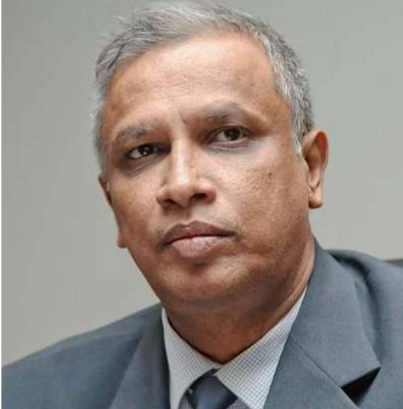
அரசியல் செயற்பாடுகள், ஆயுத செயற்பாடுகளோடு உங்களுக்கு உடன்பாடு இருக்கிறதா? நான் 'இல்லை' என்று பதில் சொல்லியிருக்கிறேன். பிறகு அதற்கான காரணத்தையும் சொல்லியிருக்கிறேன். 'எப்பொழு