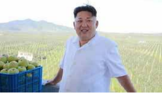
வட கொரிய அதிபர் கிம் ஜாங் உன், நாட்டின் உணவு உற்பத்தியை அதிகரிக்க அறிவுறுத்தி

யமையைத் தொடர்ந்து, நம்போ நகரில் உள்ள விவசாயிகள், இயந்திரங்கள் மூலம் வயல்களில் நாற்று நடும் பணியை தீவிரப் படுத்தியுள்ளனர்.