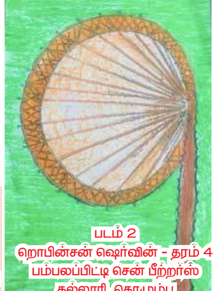
படம் 2 ஹொபின்சன் ஷெர்வின் - தரம் 4 பம்பலப்பிட்டி சென் பீற்றர்ஸ் கல்லூரி, கொழும்பு