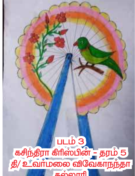
படம் 3 கசிந்திரா கிரிஸ்பின் - தரம் 5 தி/ உவர்மலை விவேகாநந்தா கல்லூரி