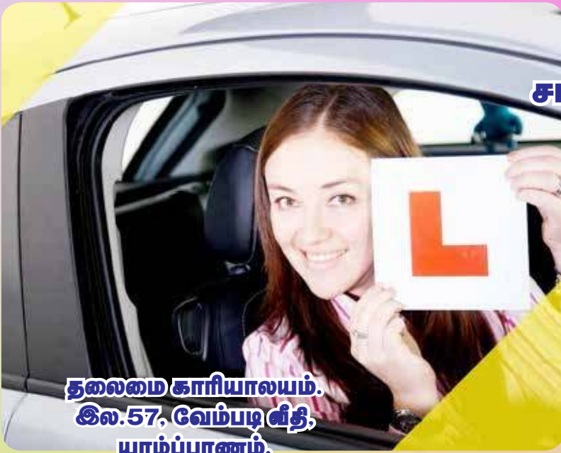
தலைமை காரியாலயம். இல.57, வேம்படி வீதி, யாழ்ப்பாணம்.

முறையான சாரத்தியத்தைக் கற்றுக் கொள்ள எம்முடன் இணைந்து கொள்ளுங்கள்.