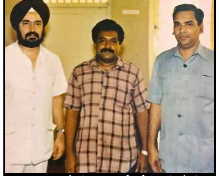
கொழும்பு, மே 20 இலங்கையில் தான் தூதரக அதிகாரியாக இருந்தபோது தமிழீழ பக்கம் 02 >>>