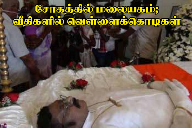
சோகத்தில் மலையகம்; வீதிகளில் வெள்ளைக்கொடிகள்