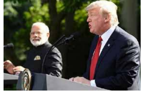
வருவதால் அவர் நல்ல மனநிலையில் இல்லை.

சீன எல்லைப் பிரச்சினை குறித்து இந்தியப் பிரதமர் மோடியுடன் தாம் பேசியுள்ளார் என அமெரிக்க ஜனாதிபதி டிரம்ப் தெரிவித்துள்ளார். லடாக் எல்லையில் சீனா படகுகளைக் குவித்து இருப்பதால், இந்தியாவும் அங்கு தனது படைப் பலத்தை அதிகரித்து வருகிறது. இதனால் அங்கு பதற்ற நிலை ஏற்பட்டு உள்ளது.