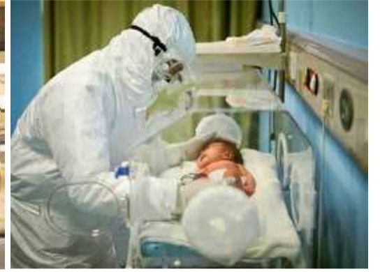
அதிர்ச்சியில் மெக்சிக்கோ சுகாதாரத் துறை

ஒரே பிரசவத்தில் பிறந்த 3 குழந்தைகளுக்குக் கொரோனா வைரஸ் பாதிப்பு ஏற்பட்டிருக்கிறது. மெக்சிக்கோவில் இந்தச் சம்பவம் நடந்துள்ளது. இதுவரை இப்படியான ஒரு சம்பவம் நடந்ததில்லை என்று குறிப்பிடுகிறார்.