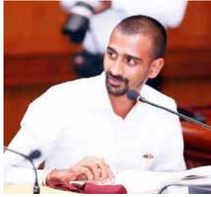
பிரதிநிதிகளே இவ்வாறு வாழ்த்துகூறி, இ. தொ. காவின வெற்றிக்கு துணை நிற்கும்படி கோரியுள்ளார்.

நுவரெலியா மாவட்டத்தை மையமாகக் கொண்டிருக்கும் இளைஞர் அமைப்புகள், விளையாட்டுக்கழகங்கள், தன்னார்வ தொண்டு அமைப்புகள், மாதர் சங்கங்கள், கல்விசார் அமைப்புகள் மற்றும் கலை, கலாச்சார ஒன்றியங்கள் போன்றவற்றின்