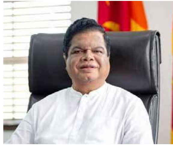
தின முதலாவது வரவு - செலவு திட்டத்தில் நாட்டின் பொருளாதாரத்தை மாற்றிய

எனினும் இன்னொரு நோய் தாக்கம் வராவிட்டால் எம்மால் மீள முடியும் என்பதையும் கவனத்தில் கொள்ள வேண்டும். எவ்வாறு இருப்பினும் புதிய அரசாங்கத்