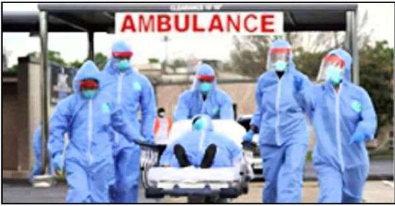
(நியூயோர்க்) அமெரிக்காவில் கொரோனா வைரஸ் தாக்குதலுக்கு நேற்று

முன்தினம் ஒரே நாளில் ஆயிரத்து 897 பேர் உயிரிழந்தனர். இதனால் அந்நாட்டில் வைரஸ்