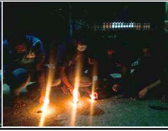
நாள் நினைவுஞ்சலி நிகழ்வுகள் மற்றும் குமுதினிப்படுகொலை நினைவு தினமும் நேற்று முன்