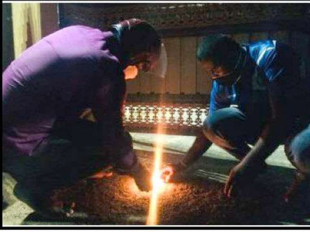
(முல்லைத்தீவு) முள்ளிவாய்க்கால் நினைவேந்தல் வாரத்தின் மூன்றாம்