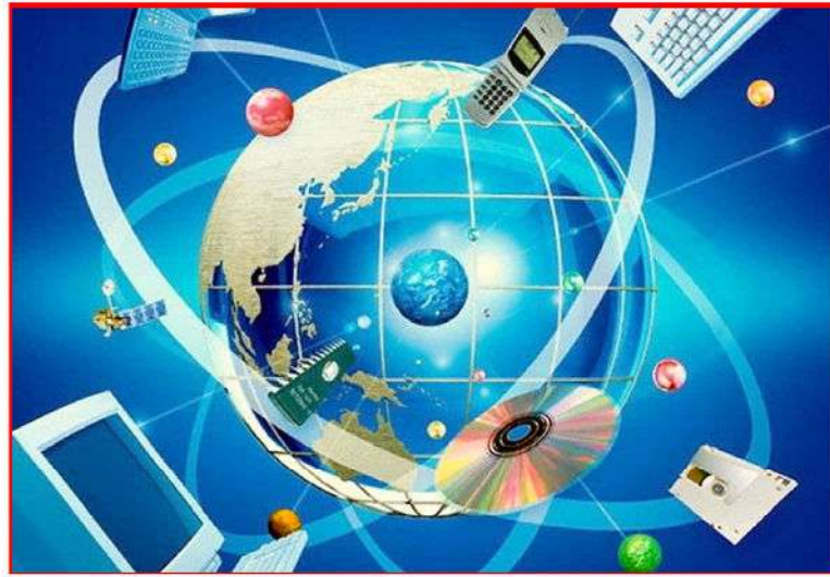
சர்வதேச தொலைத்தொடர்பு மற்றும் தகவல் சமூக தினம் இன்றாகும். இதனை முன்னிட்டு அக்டோபர் அங்கு பிரசுரமாகிறது.

அலெக்ஸ்சாண்டர் கிரகம்பெல் தனது ஆராய்ச்சிப் பணிக்கு தோமஸ் வாட்சன் என்ற துணை ஆராய்ச்சியாளரை பணிக்கு அமர்த்தினார். இருவரும் பணிக்