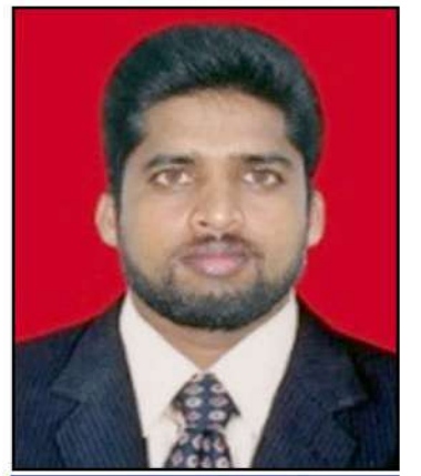
ம.யிரான்சிங்க், கத்தோலிக்க சுதந்திர பத்திரிகையாளர்-தொடர்பாடல்-ஊடகவியற் கற்கை, ஆசிரியர்-யா-மதமல்த பெண்கள் உயர்தரப் பாடசாலை

விரல் நுணியால் சடக்கெனத்தட்ட சொடக்கொன விழும் திரையில் அகிலத்தின் அசைவுகளை இருந்த இடத்தில் இருந்தே அறி