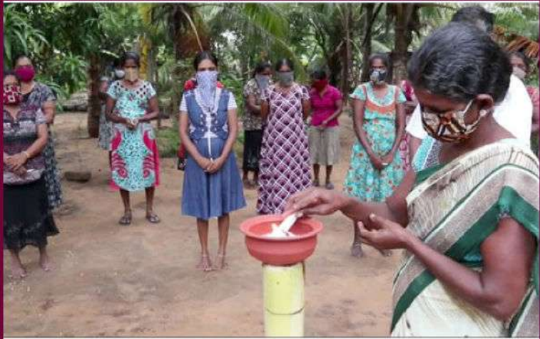
முள்ளிவாய்க்காலில் மக்கள் படுகொலை செய்யப்பட்டதன் 11 ஆம் ஆண்டு நினைவு நிகழ்வு நாளை 18 ஆம் திகதி நடைபெறவுள்ள நிலையில் நினைவேந்தல் வாரத்தின் ஆரம்ப நிகழ்வுகள் முல்லைத்தீவு மாவட்டத்தில் கடந்த 13 ஆம் திகதி கூடர் ஏற்றி ஆரம்பிக்கப்பட்டன. தமிழ்த் தேசிய மக்கள் முன்னணியின் ஏற்பாட்டில் முல்லைத்தீவு மாவட்டத்தில் மாங்குளத்தில் கூடர் ஏற்றி வணக்கம் செலுத்தப்பட்டது. (இ-4-281)