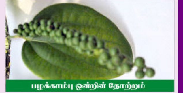
பழக்காம்பு ஒன்றின் தோற்றம்

➤ பின்னர் இவற்றை 5-6 நாட்கள் நன்கு காய விடுவதன் மூலம் கறுப்பு நிறமான மிளகினைப் பெற்றுக் கொள்ள முடியும்.