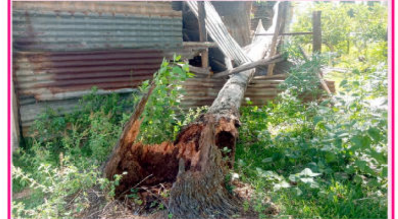
வவுனியா மாங்குளம் பகுதியில் நேற்று காலை வீசிய பலத்த காற்றின் காரணமாக தென்னை மரம் விழுந்ததில் வாகனம் திருத்தமிடம் சேதமடைந்துள்ளது. (படம்:- குருமன்காடு செய்தியாளர்)

இலங்கைப் போக்குவரத்து சபைக்கு சொந்தமான பேருந்தில் வவுனியா, மன்னார் மாவட்டத்தைச் சேர்ந்த 25 இற்கும் மேற்பட்ட மக்கள் அபாய வலயங்களிலிருந்து அழைத்து வரப்பட்டு அந்தந்தப் பகுதி பொலிஸ் நிலையத்தில் பதிவினை மேற்கொண்ட பின்னர் வீடுகளுக்குச் செல்ல அனுமதிக்கப்பட்டனர். (2-5-250)