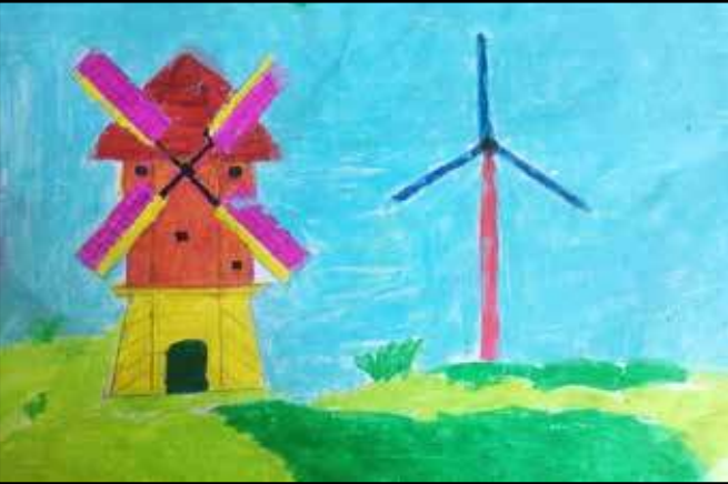
படம் 1 ஜெ. நிருஜன் - தரம் 5 தி/ உவார்மலை விவேகாநந்தா கல்லூரி