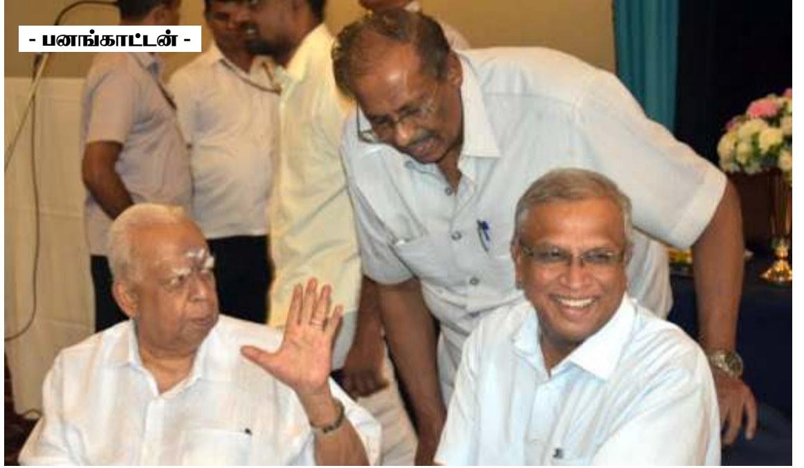
- பனங்காட்டன் -

சில வாரங்களுக்கு முன்னர் எதிரும் புதிருமாக