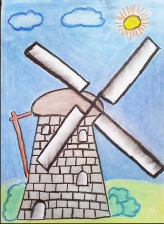
படம் 2 ராமதாசன் ஷர்சீகா - தரம் 4 தி/ உவார்மலை விவேகாநந்தா கல்லூரி