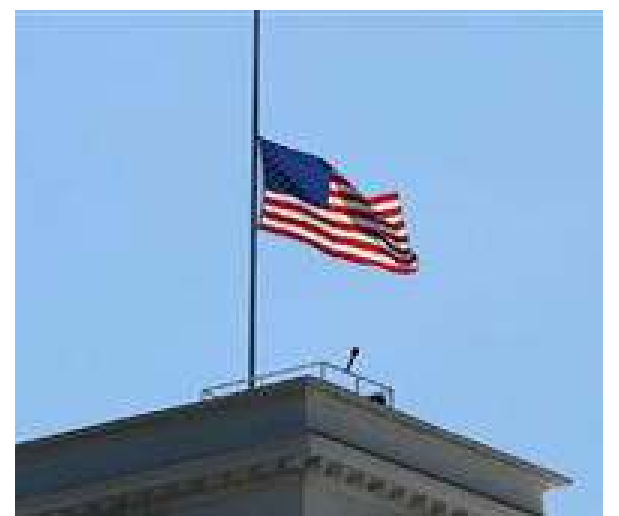
மதிப்பளிக்கும் வகையில் தேசியக்கொடிகள் அரைக்கம்பத்தில் பறக்கும் என டிரம்ப் டூவிட்டரில் பதிவிட்டுள்ளார். கொரோனா உயிரிழப்பு ஒரு லட்சத்தை எட்ட உள்ள இந்த துயரமான நாளில், அஞ்சலி செலுத்த வேண்டும் என ஜனநாயகக் கட்சித் தலைவர்கள் கேட்டுக் கொண்டதையடுத்து டிரம்ப் இந்த உத்தரவை பிறப்பித்துள்ளார் என்பது குறிப்பிடத்தக்கது.

அமெரிக்காவில் அடுத்த மூன்று நாட்களுக்கு தேசியக் கொடிகளை அரைக்கம்பத்தில் பறக்கவிடும் படி அதிபர் டிரம்ப் உத்தரவிட்டுள்ளார். அமெரிக்காவில் கொரோனா வைரசின் தாக்கம் தொடர்ந்து உச்சத்தில் உள்ளது. 16.2 லட்சம் பேருக்கு இதுவரை கொரோனா தொற்று உறுதி செய்யப்பட்டுள்ள நிலையில், 96 ஆயிரத்துக்கும் மேற்பட்டோர் உயிரிழந்துள்ளனர். இறப்பு எண்ணிக்கை விரைவில் ஒரு லட்சத்தை எட்டும் என அஞ்சப்படுகிறது. நோய்த்தடுப்பு நடவடிக்கைகள் ஒருபுறம் தீவிரமாக நடைபெற்றாலும், உயிரிழப்புகளை தடுக்க முடியாமல் மருத்துவத் துறை தீன்றி வருகிறது. இந்த நிலையில், கொரோனாவால் உயிரிழந்த அமெரிக்கர்களுக்கு அஞ்சலி செலுத்தும் வகையில் அடுத்த மூன்று நாட்களுக்கு தேசியக்கொடிகளை அரைக்கம்பத்தில் பறக்க விடும் படி அதிபர் டிரம்ப் உத்தரவிட்டுள்ளார். "கொரோனா வைரசால் உயிரிழந்த அமெரிக்கர்களின் நினைவாக அடுத்த மூன்று நாட்களில் அனைத்து மத்திய அரசு அலுவலக கட்டிடங்கள், தேசிய நினைவுச் சின்னங்களில் தேசியக் கொடிகளை அரைக்கம்பத்தில் பறக்கவிடும்படி உத்தரவிட்டுள்ளேன். மேலும் நாட்டிற்கு சேவை செய்து உயிரிழந்த படைபினரின் நினைவு நாளையொட்டி அவர்களுக்கு