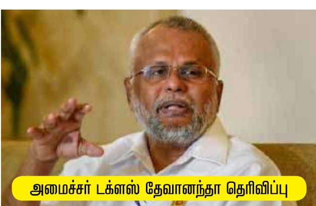
அமைச்சர் டக்ளஸ் தேவானந்தா தெரிவிப்பு

யாழ்ப்பாணம், மே 27 கடற்றொழில் மற்றும் நீரக வள மூலங்கள் அமைச்சினால் யாழ். மாவட்டத்தில் பெண்களை தலைமைத்துவமாக கொண்ட குடும்பங்கள் மற்றும் கடற்றொழில் சார்ந்த மக்களின் வாழ்வாதார தேவைகருதி பல்வேறு நலத்திட்டங்களை முன்னெடுக்க நடவடிக்கை மேற்கொள்ளப்பட்டுள்ளதாக கடற்றொழில் மற்றும் நீரக வள மூலங்கள் அமைச்சர் டக்ளஸ் தேவானந்தா தெரிவித்துள்ளார். இது தொடர்பில் அமைச்சர் மேலும் தெரிவித்ததாவது:- யாழ். மாவட்டத்தில் வறுமை நிலையில் இருக்கும் மக்களின் வாழ்வாதார மேம்பாடுகளை முன்னிறுத்தியே இந்தத் திட்டம் நடைமுறைப்படுத்தப்படுகின்றது. குறிப்பாக பெண்களைத் தலைமைத்துவமாகக் கொண்ட 100 க்கும் அதிகமான வறிய குடும்பங்களுக்கு கருவாடு பதனிடும் உபகரணங்கள் வழங்கப்படவுள்ளன. அத்துடன் கடற்றொழில் சார் மக்களின் சுகாதார மேம்பாடுகளை முன்னிறுத்தி 210 குடும்பங்களுக்கு மலசல கூடங்கள் திருத்துவதற்கான நிதி உதவியும் எமது அமைச்சினால் வழங்கப்பட நடவடிக்கை எடுக்கப்பட்டுள்ளது. மேலும் கடற்றொழில் சார் 30 குடும்பங்களுக்கு வீடுகளை புனரமைப்பதற்கான குறிப்பாக கட்டி முடியாத நிலையில் உள்ள வீடுகளை புனரமைப்பதற்கான நிதி