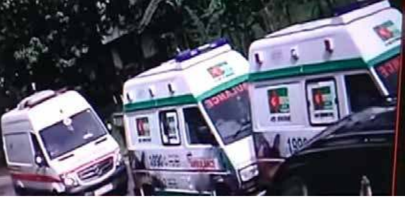
விபத்துக்குள்ளாகின் எனத் தெரிவிக்கப்பட்டது. இருப்பினும் எந்த நோயாளியும் காயமடையவில்லை. அவர்கள் அனைவரும் பொலிஸாரின் உதவி