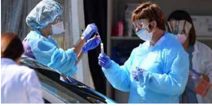
கொரோனா தொற்று காரணமாக அமெரிக்காவில் உயிரிழந்தோர் எண்ணிக்கை ஒரு லட்சத்தைக் கடந்துள்ளது. வைரஸ் தொற்றின் மையமாக மாறிப்போன அந்நாட்டில்

பெருந்தொற்று ஏற்பட்டதால், பாதிக்கப்பட்டவர்களின் எண்ணிக்கை 17 லட்சத்து 25 ஆயிரத்தைக் கடந்தது. மேலும் இன்று காலை நிலவரப்படி 736 பேர் உயிரிழந்தமையைத் தொடர்ந்து, அமெரிக்காவில் கொரோனா பாதிப்பால் பலியானோர் எண்ணிக்கை ஒரு லட்சத்து 500 ஆக உயர்ந்துள்ளது.