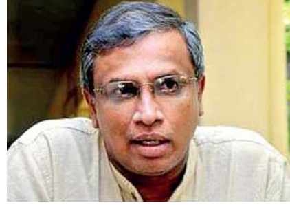
தேசியப் பட்டியல் ஊடாக நாடாளுமன்றத்துக்குள் நுழைய மாட்டேன் என தமிழ் தேசிய கூட்டமைப்பின் ஊடகப் பேச்சாளரும் முன்னாள் நாடாளுமன்ற

உறுப்பினருமான எம்.ஏ.சுமந்திரன் தெரிவித்துள்ளார்.