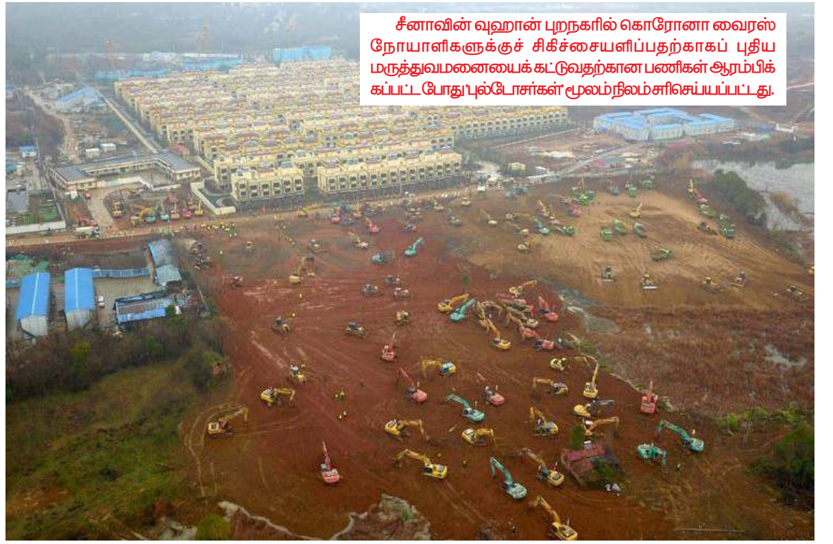
சீனாவின் வுஹான் புறநகரில் கொரோனா வைரஸ் நோயாளிகளுக்குச் சிகிச்சையளிப்பதற்காகப் புதிய மருத்துவமனையைக் கட்டுவதற்கான பணிகள் ஆரம்பிக்கப்பட்டபோது பூல்போசர்கள் மூலம் நிலம் சரிசெய்யப்பட்டது.