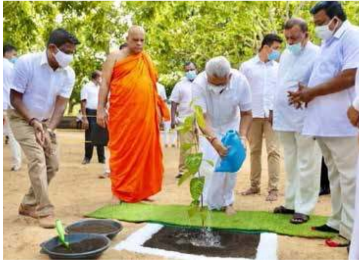
மிஹிந்தலை ரஹ்மஹா விஹாரையில் இடம்பெற்ற அரசு பொசன் விழாவின் போது, சர்வதேச சுற்றுச் சூழல் தினத்தை முன்னிட்டு ஜனாதிபதி கோட்டாபய ராஜபக்ஷ மரநடுகையில் ஈடுபட்ட போது..