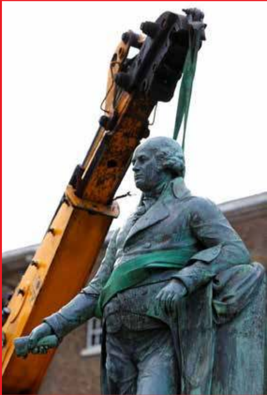
பிரிட்டனின் லண்டன் நகரில் நிறுவப்பட்டுள்ள சிலைகளில் பெரும்பாலானவை அகற்றப்பட்டு வரு

கின்றன. இதன் முதற்கட்டமாக 18ஆம் நூற்றாண்டில் அடிமைகளை வைத்து வர்த்தகத்தில் ஈடுபட்ட ரொபர்ட் மில்லிகனின் சிலை லண்டன் அருங்காட்சியகத்துக்கு வெளியே வைக்கப்பட்டிருந்த நிலையில் அது அகற்றப்பட்டது. உயர்ந்த பீடத்தில் நிறுவப்பட்டிருந்த குறித்த சிலையை அதன் அத்திபாரத்திலிருந்து பிரித்தெடுத்து, பாரந்தூக்கி மூலம் தூக்கி எறியும்போது சூழ்ந்திருந்த வர்கள் ஆரவாரம் செய்து பாராட்டினர். அங்குள்ள பல சிலைகளை அகற்றுவதற்கான நடவடிக்கைகள் முடுக்கிவிடப்பட்டுள்ளன.