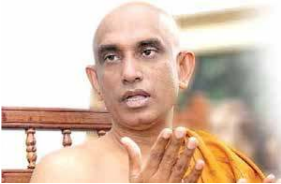
கொழும்பு, ஜூன் 11

அமைதியாக இடம்பெற்ற போராட்டத்தை பொலிஸார் தான் கலவரமாக மாற்றினார்கள் என முன்னாள் நாடாளுமன்ற உறுப்பினர் அத்துரலிய ரத்ன தேரர் சாடியுள்ளார்.