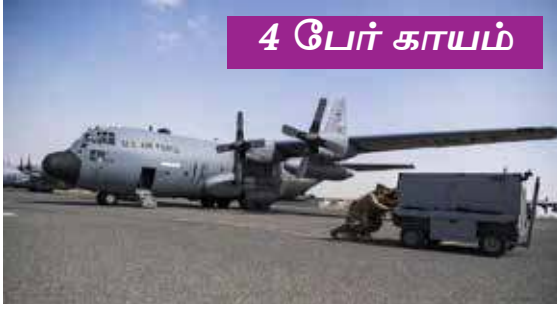
4 பேர் காயம்

ஈராக்கில் தரையிறங்கிய அமெரிக்கப் போர் விமானம் விபத்துக்குள்ளாகியது. 'சி 130 எச் ஹெர்க் லிஸ்' என்ற விமானமே நேற்று முன்தினம் இரவு ஈராக்கின் தலைநகர் பாக்தாத் அருகேயுள்ள கேம்ப் தாஜிவிமானப்படை தளத்தில் தரை இறங்க முயற்சித்த