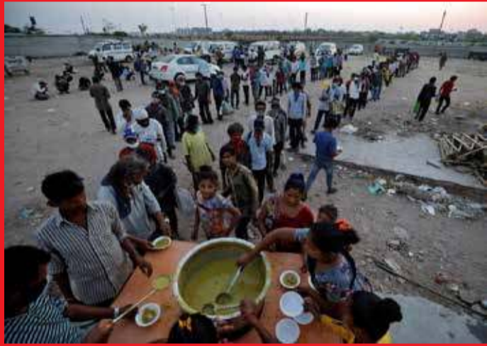
தெற்காசியா, முக்கியமாக மக்கள் தொகை கொண்ட இந்தியா, இதைத் தொடர்ந்து துணை - சஹாரா ஆபிரிக்கா ஆகியன கருதப்படுகின்றன.