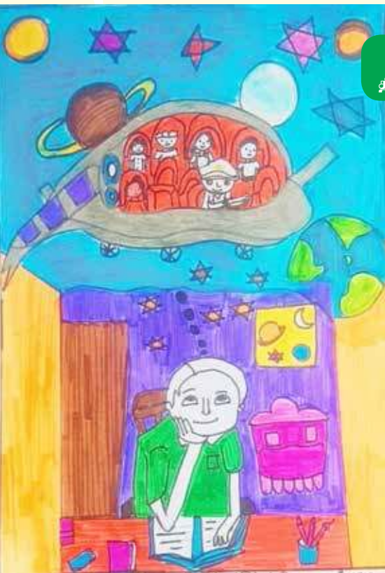
படம் 1 வி. ரீதீஷிதன் - தரம் 4 தி/ கோணேஸ்வரா இந்துக் கல்லூரி