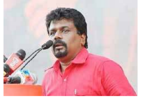
ரீதியாக முரண்பாடுகள் காரணமாக அதில் இருந்து விலகி முன்னிலை சோசலிசக் கட்சியை ஆரம்பித்தமை குறிப்பிடத்தக்கது.

ஏற்கனவே பல்வேறு சக்திகளுடன் இணைந்து செயற்பட தமது கட்சி ஆரம்பித்துள்ளதாகவும், தேசிய மக்கள் சக்தி அமைப்பு அப்படியான தொரு அமைப்பே எனவும் அவர் கூறியுள்ளார். மக்கள் விடுதலை முன்னணியில் இருந்து விலகிச் சென்றவர்கள் என்றாலும் அந்தக் கடந்த காலத்தை மறந்துவிட்டு முன்னிலை சோசலிசக் கட்சியுடன் இணைந்து செயற்படத் தயாராக இருப்பதாகவும் அனுகுமார திஸாநாயக்க குறிப்பிட்டார். குமார் குணரட்னம் தலைமையிலான முன்னிலை சோசலிசக் கட்சியினர் மக்கள் விடுதலை முன்னணியில் அங்கம் வகித்ததுடன் அந்த முன்னணிக்குள் ஏற்பட்ட கொள்கை