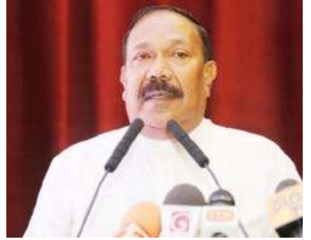
வானது. நாமும் அந்தக் கூட்டணியிலேயே இருக்கின்றோம். மக்கள் அந்தக் கூட்டணியையே ஆதரிக்க வேண்டும் - என்றார்.

இதேவேளை, மைத்திரிபால சிறிசேன சுதந்திரக் கட்சியை இல்லாது செய்ததாலேயே மொட்டுக் கட்சி உருவானது. அதேபோல் ரணில் விக்கிரமசிங்க ஐக்கிய தேசியக் கட்சியை இல்லாது செய்ய முற்படுவதாலேயே சஜித் பிரேமதாஸ தலைமையில் ஐக்கிய மக்கள் சக்தி உரு