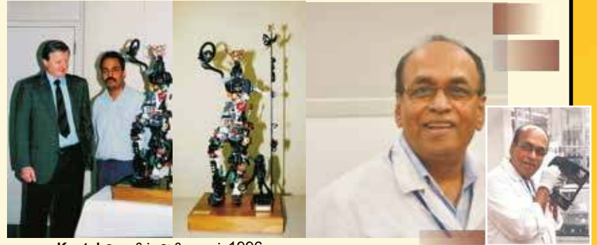
Kostal தொழில் அதிபருடன் 1996

அச்சக்கலைக்கும் இந்தநகரம் பெயர் பெற்றது 2013 ஆண்டு பேர்லின் நகரில் நடைபெற்ற புத்தகக்கண்காட்சியில் Druck & Medien Awards 2013 என்ற விருது Seltmann Printart GmbH Lüdenscheid க்கு கிடைத்தது. இந்த அச்சகத்தில் வெற்றி மணி சிவத்தமிழ் அச்சாகி வெளிவருகிறது.(1999 முதல்)