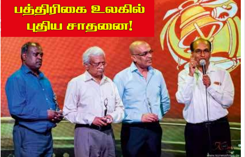
1994 முதல் இன்று வரை தொடர்ச்சியாக வெற்றிமணிக்கு விளம்பர அனுசரணை தந்து சாதனை படைத்த 3 வர்த்தக ஸ்தாபனத்தினர். 01.எசன்:அபிராமி என்றபிறைஸ்.02.OT.S 03.TTS Brothers (Dortmund)

இவ்வாறான மனிதர்களை சிந்தித்துப் பார்க்கின்ற போது வாழ்க்கை என்பது வழுக்கை என்று நினைத்தாலும், எதற்காவது வாழ வேண்டும் என்ற நினைப்பானது முனை சுறுசுறுப்பான மனிதர்களுக்கு தோன்றிக் கொண்டே இருக்கும். இது இயற்கையின் நியதி, கோட்பாடு என்றே கூறலாம்.