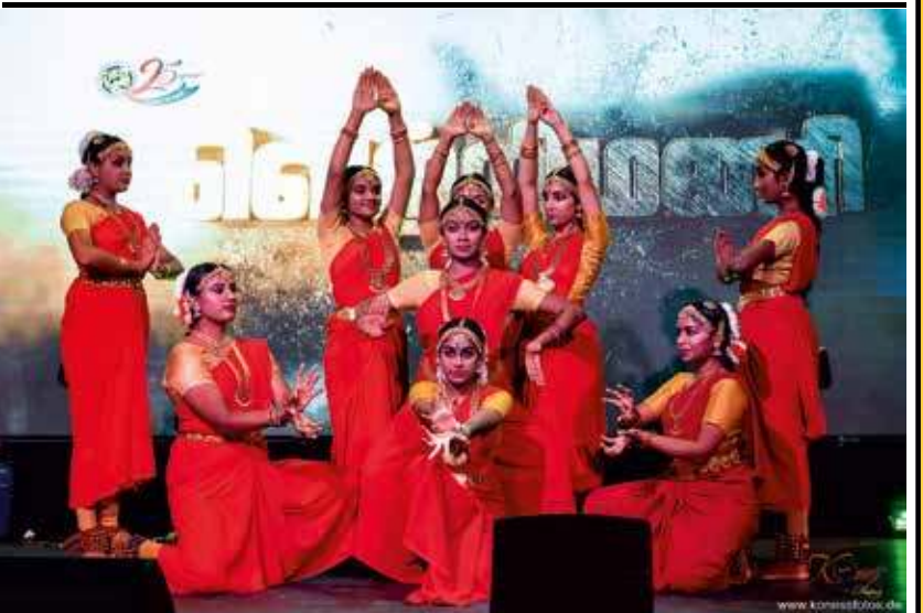
வெற்றிமணி வெள்ளிவிழாவில் இடம்பெற்ற நடனத்தில் நிருத்திய நாட்டியாலய மாணவிகள் தந்த நடனம் இது. பல அழகிய படங்கள் தொடர்ந்து வெளிவரும்.