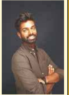
வெற்றியணி வெள்ளிவிழாவில் வெற்றியணி விருது பெற்ற இளம் எழுத்தாளன்

ஆகவே ஊடக ஆளுமை என்பது பெருமிதத்திற்குரியதல்ல. எவரும் விரும்பினால் தம் தேவைக்காக அதைக் கற்றுக்கொள்ளலாம். நானிருக்கும் இரயில் பெட்டியில் ஒரு துருக்கி மாமா யாரோ தொலைபேசியை எடுத்து, தொலைபேசி எண்ணொன்றைக் கேட்க, அதை Copy Paste பண்ணத்தெரியாது, அழைப்பைத் துண்டித்து, இலக்கத்தை ஒரு Tissue இல் எழுதி, மீண்டும் அழைப்பை ஏற்படுத்தி, இலக்கத்தை இரயில் முழுதும் கேட்க உரத்துச்சொன்னார்.