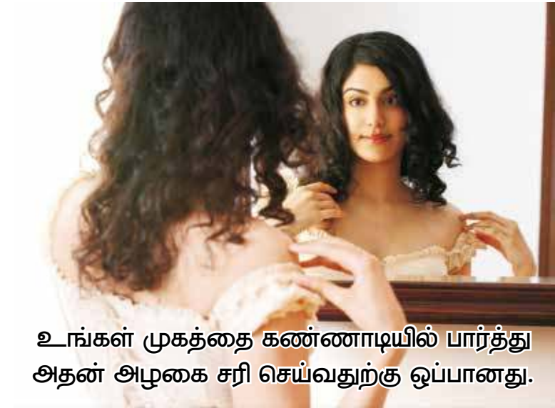
உங்கள் முகத்தை கண்ணாடியில் பார்த்து அதன் அழகை சரி செய்வதற்கு ஒப்பானது.

மனிதர்கள் பயங்கரமானவர்கள் அவ்வப்போது அவர்களிடம் மிருகத்தனம் வெளிப்படும். அன்புக்காக ஏங்குவது போன்றது கூட நடப்பாக இருக்கலாம்.