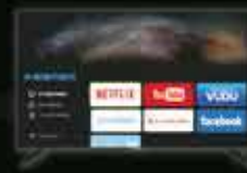
தொலைக் காட்சிப் பெட்டி