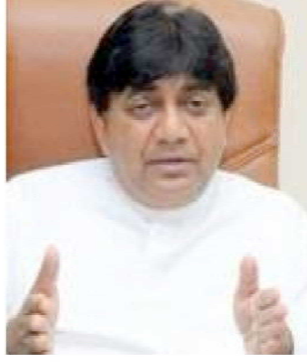
வர். இவ்வாறானவர்கள் தொடர்பில் உடன்கவனம் செலுத்த வேண்டும்.

ஜூன் மாதம் 20 ஆம் திகதி பொதுத்தேர்தலை நடத்த எதிர் பார்த்துக்கொண்டது. தேர்தல்கள் ஆணைக்குழுவின் உறுப்பினர்களில் ஒரு சிலர் பொதுத்தேர்தல் நடத்துவதைத் தவிர்க்கும் விதத்திலான கருத்துக்களை வெளியிடுகின்றனர். எனவே தேர்தல்கள் ஆணைக்குழுவின் தலை