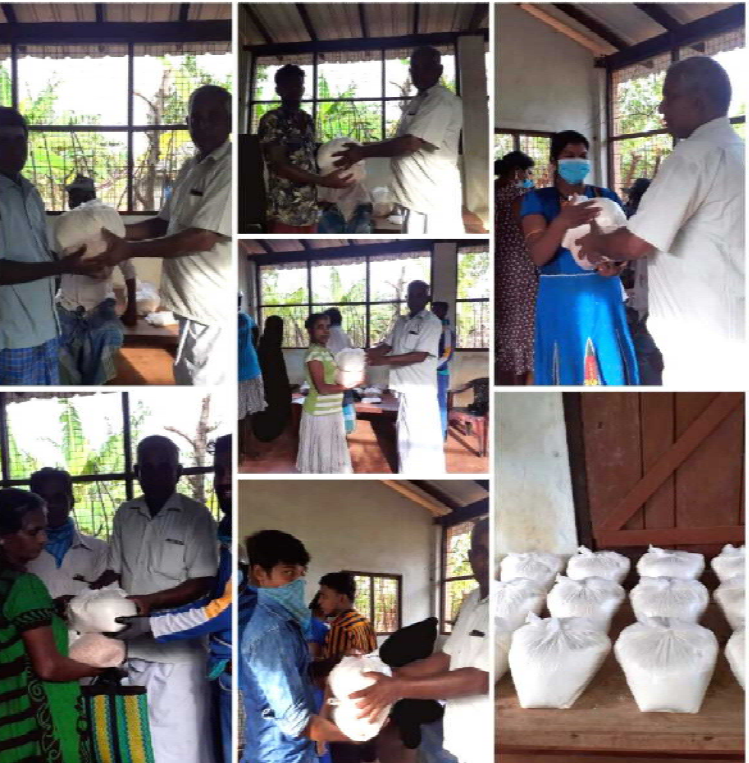
கொரோனா வைரஸ் காரணமாக நாட்டில் ஊரடங்குச் சட்டம் அமுல்படுத்தப்பட்டிருப்பதனால் பாதிக்கப்பட்டிருந்த கிராம மக்களுக்கு அச்செழு மேற்கு சடையகாடு ஐங்கரன் சனசமூக நிலையத்தினரால் உலர் உணவுப் பொதிகள் வழங்கி வைக்கப்பட்டன. (ஞர்)