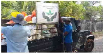
கொரோனா வைரஸ் தொற்றுக் காரணமாக அமுல்படுத்தப்பட்டிருந்த ஊரடங்குச் சட்டத்தால் பாதிக்கப்பட்ட

தீவகம்பேலையைப் பிரதேசத்திலுள்ள 9 கிராமசேவை உத்தியோகத்தார் பிரிவிலுள்ள 1850 குடும்பங்களுக்குத் தேவையான அத்தியாவசிய உலருணவுப் பொருட்கள் புலம்பெயர் தேசத்தில் வசித்து வரும் வேலையை உறவுகளின் நிதிப்பங்களிப்பிலும் வேலையை விழிவள்ளி அமைப்பின் ஏற்பாட்டிலும் வழங்கப்பட்டன.