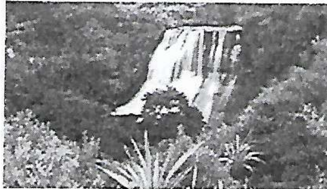
நியூசிலாந்து வடதீவின் கிழக்கில் Gisborne குக்கிட்ட உள்ள Papakorito நீர் வீழ்ச்சி.

அவளையும் மாறி மாறிப் பார்த்தான். அவளைப் பார்த்ததும் தாயில்லாத் தங்கையில் வைத்திருந்த பாசம் முந்திக் கொண்டிருந்தது. ஏசுவாய் திறந்தான். வார்த்தையே வர மறுத்துவிட்டது. அறிவோ, அவள்மீது வைத்திருந்த பாசமோ நாவை அடக்கி வைத்துக் கொண்டிருந்தது. "சரி, நீ போ; எல்லாம் ஆறுதலாகக் கதைக்கிறேன்." என்று சொல்லிவிட்டு அருகிலிருந்த நாற்காலியில் அமர்ந்தான். "என்னடா, சங்கதி?" என்று கந்தையர் கேட்க ஒன்றுமில்லை என்பதுபோலத் தலையாட்டினான். படலை தட்டுஞ் சத்தங் கேட்டு வாயிற் கதவைத் திறந்து பார்த்தான். பெரிய தகப்பனாரைக் கண்டதும்" வாருங்கோ, வாருங்கோ பெரியப்பா" என்றான். கந்தையரும் எழுந்து சென்று வரவேற்றார். வந்தவர் "பிள்ளையின் சாதகத்தைக் கொண்டு வாருங்கோ. ஏஜீயே கேட்கிறார்" என்று சொல்லிக் கொண்டே இருந்தார். தகப்பனும் மகனும் ஆளையாள் பார்த்தனர். பகீரதனுக்குக் கொதித்துக் கொண்டிருந்த உள்ளம் திடீரெனக் குளிர்ந்தது. என்ன நிகழ்ந்திருக்கக்கூடும் என்பது அவனுக்குப் புலனாயிற்று. "ஆனைவிழுந்தான் பிள்ளையாரே" என்று திசை நோக்கித் தொழுதான். பக்தி வெள்ளங் கரைபுரளத் தொடங்கிவிட்டது. சாதகம் எடுக்க உள்ளே சென்றவன் வெகு நேரமாக வரவில்லை. பார்க்கச் சென்ற தகப்பன் வந்து "படத்துக்கு முன்னாற் சாதகத்தை வைத்துவிட்டு அமுதமுது கும்பிட்டுக் கொண்டிருக்கிறான்." என்றார். தமையனார் புன்னகையோடு "ஆனந்தக் கண்ணீராக்கும்; அவசரமில்லை; நல்லாய்க் கும்பிடட்டும்;" ஏஜீயே, கூட்டம் முடிய எங்கள் வீட்டுக்கு நேரே வந்துவிட்டார்; அவர் தனியாள்தானே; கலைமகள் கொடுத்து வைத்தவள்; கூரையைப் பிய்த்துக் கொண்டு வந்துவிட்டது அதிட்டம்"