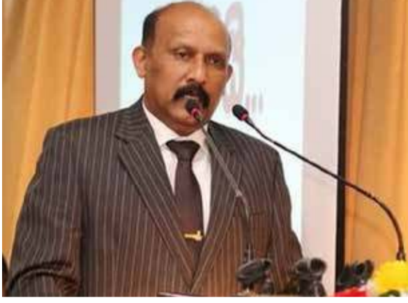
அவர் - போதைப்பொருள் மற்றும் பல்வேறு சட்டவிரோத குற்றச் செயல்கள் பாரியளவில் இடம்பெறும் நிலையில்