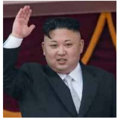
அதிகபட்ச எச்சரிக்கையுடன் மக்கள் இருக்க வேண்டும் என்று கிம் தெரிவித்தார் என்றுள்ளது.

உலகளாவிய சுகாதார நெருக்கடி இருந்தபோதிலும், வீரியம் மிக்க வைரஸின் ஊடுருவலை நாங்கள் முற்றிலுமாகத் தடுத்துள்ளோம். தொற்றுநோய்க்கு எதிரான ஒரு நிலையான சூழ்நிலையைப் பராமரித்துள்ளோம். இது ஒரு பிரகாசமான வெற்றியாகும். அதேசமயம் தொற்றுநோய்க்கு எதிரான முயற்சியில் சுய - மனநிறைவு அடைந்து விட்டதாகக் கருதக்கூடாது. இன்னும்