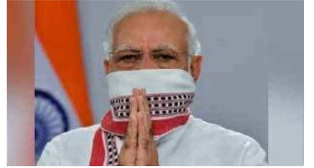
ராஜஸ்தான், மத்திய பிரதேசம், உத்தரப் பிரதேசம், மேற்கு வங்கம், ஆந்திரா, பஞ்சாப், தெலங்கானா, ஜம்மு காஷ்மீர், கர்நாடகா, ஹரியானா, பிஹார், கேரளா என இந்தியாவின் அனைத்து மாநிலங்களிலும் பாதிக்கப்பட்டவர்களின் தொகை அதிகரித்துள்ளது.

தமிழகத்தில் பாதிக்கப்பட்டவர்களின் எண்ணிக்கை ஒரு லட்சத்து 11 ஆயிரத்து 151 ஆக அதிகரித்துள்ளது. தலைநகர் டெல்லியில் கொரோனாவால் பாதிக்கப்பட்டோர் எண்ணிக்கை ஒரு லட்சத்தைத் தொடர்ந்து வந்தது. குஜராத்தில் 36 ஆயிரத்து 37 பேர் பாதிக்கப்பட்டுள்ளனர்.