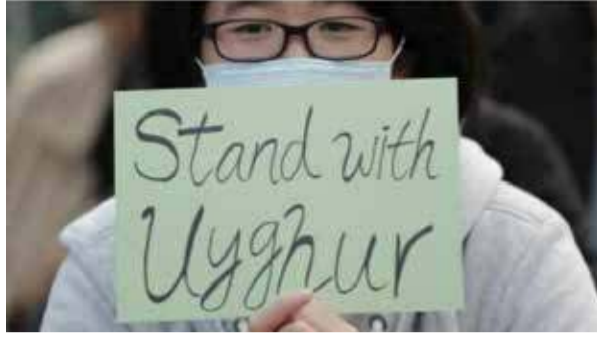
அதிகாரிகள் மீது குற்றம் சுமத்தியுள்ளது என்றும் தெரிவிக்கப்படுகிறது.

சீனாவிலுள்ள உய்குர் முஸ்லிம்கள் சீனாவில் தங்களுக்கு எதிராக நடக்கின்ற அடக்குமுறைகள் குறித்து விசாரிக்குமாறு பன்னாட்டுக் குற்றவியல் நீதிமன்றத்தை நாடியுள்ளனர் என்று இந்திய ஊடகங்கள் செய்தி வெளியிட்டன. சீனாவின் கொம்ப்யுனிஸ்ட் கட்சிக்கு எதிரான முதல் முயற்சி இது என்று அமெரிக்க ஊடகங்கள் குறிப்பிட்டன. இது தொடர்பாகப் பன்னாட்டுக் குற்றவியல் நீதிமன்றத்தில் உய்குர் முஸ்லிம்கள் குழுக்கள் 2 வழக்குப் பதிவு செய்துள்ளன. இந்த உய்குர் முஸ்லிம்கள் செயற்பாட்டுக்கு முன்பில்லண்டன் வழக்கறிஞர்கள்வாதாவிருக்கிறார்கள் என்று இவ்விரு ஊடகங்களும் தெரிவிக்கின்றன. இந்தக் குற்றச்சாட்டு தொடர்பாக முஸ்லிம்கள் முன்வைத்த குற்ற அறிக்கையில் சீன அதிபர் ஜி ஜின்பிங் உட்பட 30 சீன