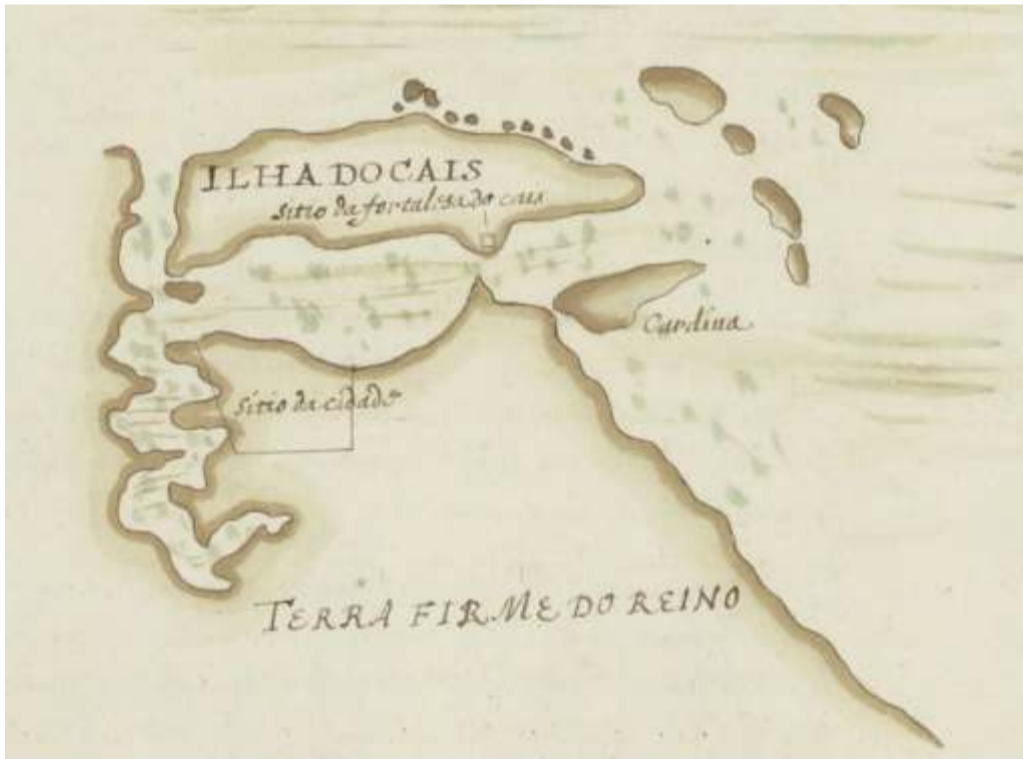
யாழ்ப்பாணத்தின் ஒரு பகுதியைக் காட்டும் போர்த்துக்கேயர் கால நிலப்படம்

இந்த நூலை எழுதிய கத்தோலிக்கக் குருவானவரான குவைரோஸ் யேசு சபையைச் சேர்ந்தவர். 1617 ஆம் ஆண்டில் போர்த்துக்கலில் பிறந்த இவர் தனது 14 ஆவது வயதில் யேசு சபையில் இணைந்தார். ஆரம்பகாலக் கல்விக்குப் பின்னர் 1635 ஆம் ஆண்டில், அவரது 18 ஆவது வயதில், 30 யேசுசபையினருடன் சேர்ந்து இந்தியாவுக்கு வந்தார். இந்தியாவில் போர்த்துக்கேயரின் தலைமையிடமாக இருந்த கோவாவில், மெய்யியல், இறையியல் ஆகியவற்றைக் கற்றுச் சில காலம் பேராசிரியராகப் பணிபுரிந்தார். பின்னர் யேசுசபையின் நிர்வாகம் சார்ந்த பதவியொன்றில் இணைக்கப்பட்ட குவைரோஸ் படிப்படியாகப் பல உயர் பதவிகளை வகித்தார். 53 ஆண்டுகள் இந்தியாவில் வாழ்ந்த இவர் 1688 ஆம் ஆண்டில் காலமானார்.