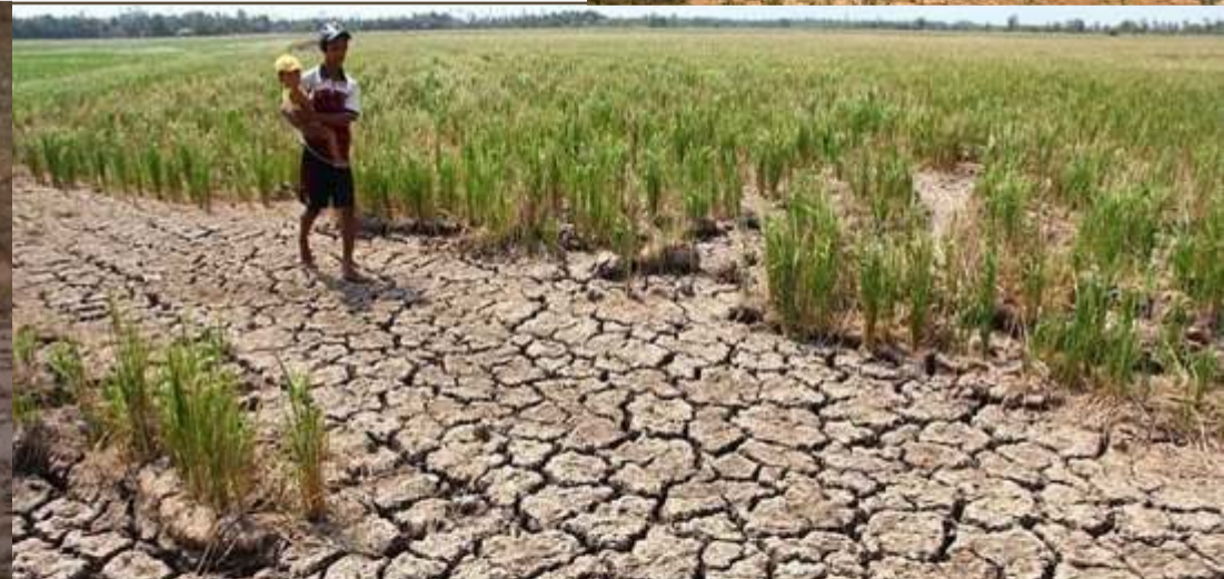
வியட்நாமில் ஏற்பட்டுள்ள வறட்சி