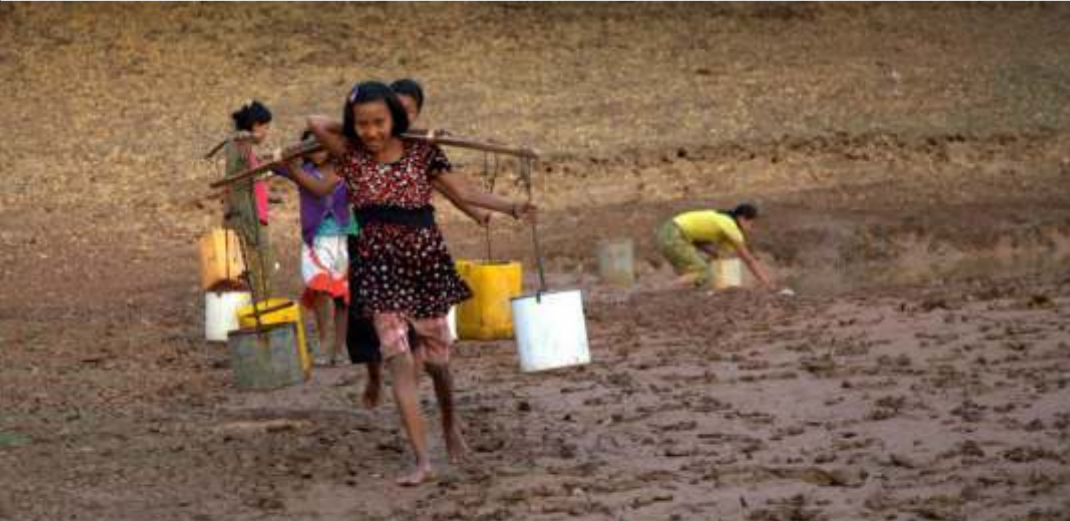
மியான்மாரில் ஏற்பட்டுள்ள வறட்சி