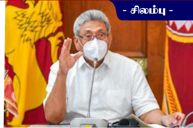
- சிலம்பு -