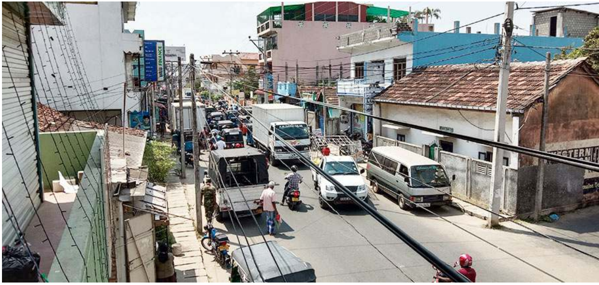
ஊரடங்கு தளர்த்தப்பட்ட பின்னர், திருகோணமலை வீதிகளில் வழமைக்கு மாறாக வாகனங்கள், மக்களின் நடமாட்டம் மிக அதிகமாகக் காணப்பட்டது. (க-40)