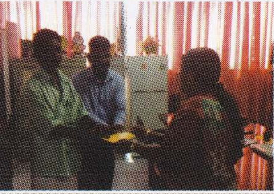
இந்து ஆலய கும்பாபிஷேக நிதியுதவி