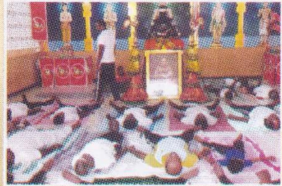
நாவிதன் வெளியில் நடைபெற்ற திருவள்ளுவர் குருபூசை தின நிகழ்வு