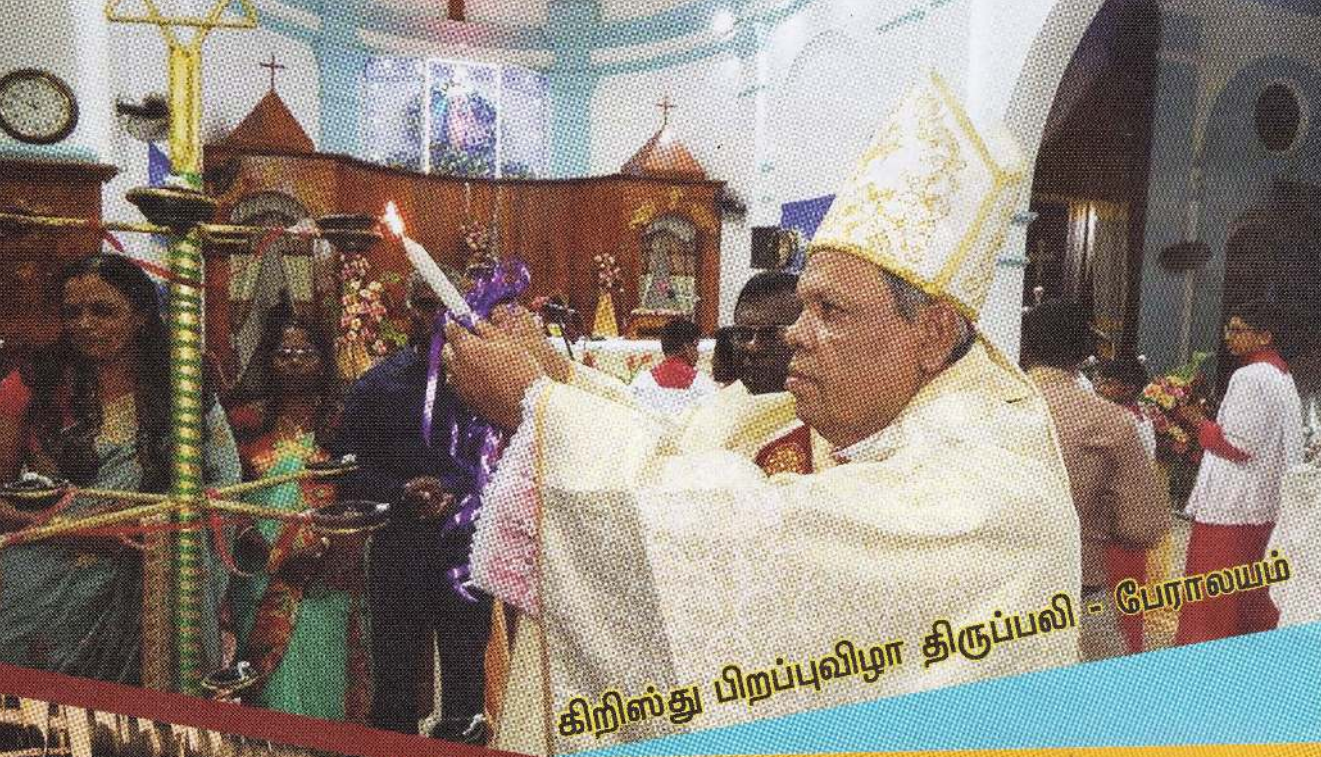
கிறிஸ்து பிறப்புவிழா திருப்பலி - பேராலயம்