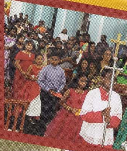
"மனித உரிமைகளுக்காக எழுவோம்"