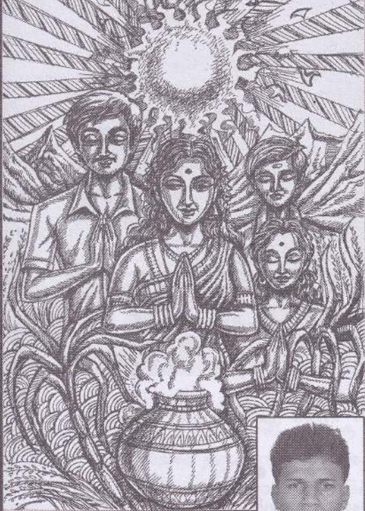
- U. டெனில்டன்