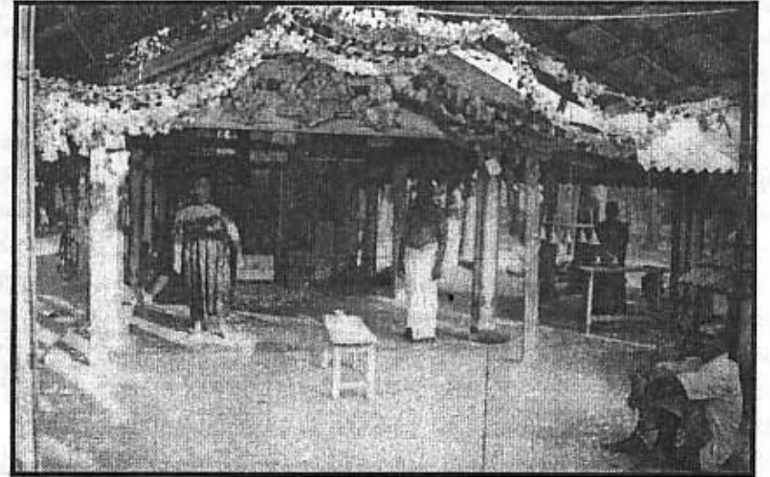
“சக்தியை வேண்டிச் சமயத்தோர்கள் உண்பர் சக்தி அழிந்தது தம்மை மறந்ததால் .....” என்று உணர்த்துகின்றது.

கிராமிய மட்டத்தில் நாட்டார் வழிபாடாகவும் அம்பிகையை வழிபடும் மரபு உள்ளது. இதில் காளி, மாரி அம்மன், கண்ணகி சிறப்பும்பெறும் தெய்வங்களாகும். அவ்வகையில் மல்லாகத்தில் முதலியம்மன் ஆதிபராசக்தி ஆலயம் சிறப்பானது. இங்கு தமிழில் பூசை இடம் பெறுகிறது. கிராமிய வழிபாட்டில் இறைவனுக்கும் வழிபடுவோருக்கும் இடையே தரகர்கள் இல்லை. தாமே நேரடியாகப் பொங்கி, மடைபரவி, உணர்வு பூர்வமாக இறைவனை வழிபடுகிறார்கள். வழிபடும் அடியவரின் சக்தியில் தெய்வம் வெளிப்பட்டு நிற்கும் என்ற நம்பிக்கை உண்டு. இம்முதலியார் கோயிலில் பூசகர் அம்மாவாகக் காணப்படுகிறார். ஆக்கபூர்வமான அருள் தரும் ஞானத்தை உள்ளத்திலே உணர்ந்தால் போதும். இதை திருமந்திரம்