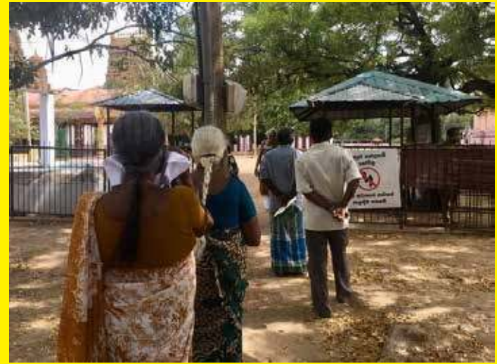
யாழ்ப்பாணம் நல்லூர் ஆலயத்துக்கு நேற்றைய தினம் பக்தர்கள் வரிசையிலேயே அனுமதிக்கப்பட்டனர். (ஒ)