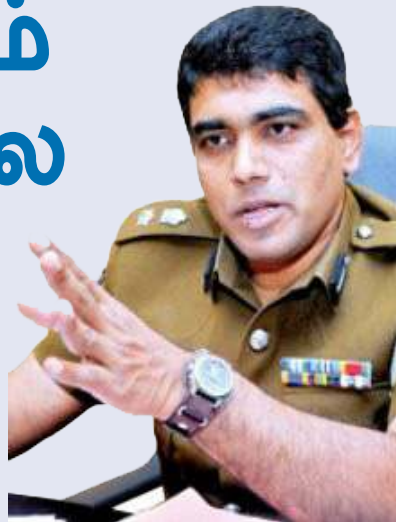
அதற்கு பதில் அளித்த பொலிஸ்மா அதிபர் ஊரடங்குச் சட்ட அனுமதிப் பத்திரகால வரையறை நீடிப்பானது ஊரடங்குச் சட்டத்தை நீடிப்பதாக அர்த்தப்படாது என்று தெரிவித்தார். (ஐ)

இந்த அறிவிப்பைத் தொடர்ந்து ஊரடங்குச் சட்டம் மே மாதம் 31 ஆம் திகதி வரையில் நீடிக்கும் என ஊடகங்கள் செய்தி வெளியிட்டிருந்தன.