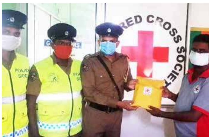
இலங்கை செஞ்சிலுவைச் சங்க கிளிநொச்சி கிளையால் கிளிநொச்சி பொலிஸ் உத்தியோகத்தர்களுக்கு கிருமி தொற்றில் இருந்து பாதுகாக்கும் அங்கிகளும் உபகரணங்களும் அண்மையில் வழங்கப்பட்டன. (ஐ-222)