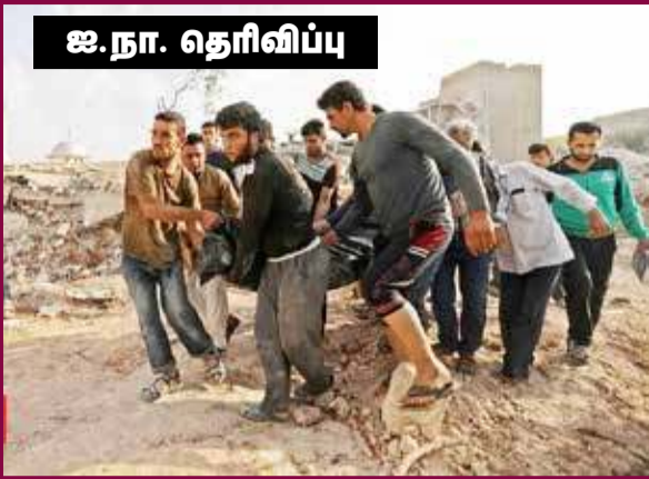
ஐ.நா. தெரிவிப்பு தரப்படும் போர்க் குற்றங்களில் ஈடுபட்டுள்ளதது என்றுள்ளது. கடந்த நான்கு மாதங்

குற்றங்கள் இழைத்துள்ளன என்று தெரிவிக்கப்பட்டுள்ளது. இது குறித்து அந்த அறிக்கையில் மேலும் தெரிவிக்கப்பட்டிருப்பதா வது: - இடலிப் மாகாணத்தில் உள்ள மருத்துவமனைகள், பாடசாலைகளில் சிரிய, ரஷ்யப் படைகள் வான் வழித் தாக்குதலை நடத்திப் போர்க் குற்றங்கள் புரிந் துள்ளன. சிரிய அரசுக்கு ஆதரவான படைகள் போர் விதிகளை மீறியுள்ளன. ஆயுததாரிகள்