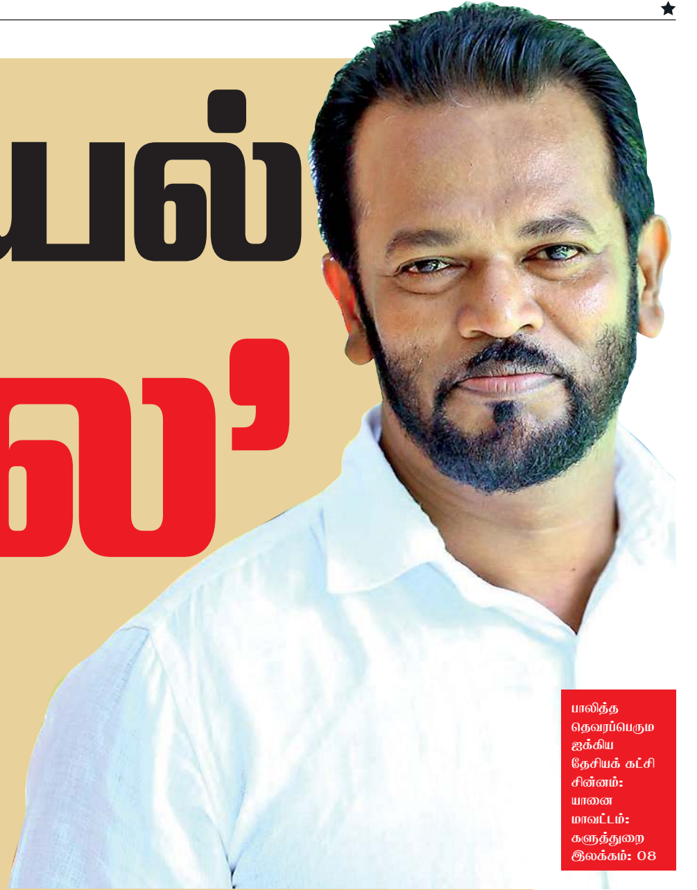
பாலித தெவர்ப்பெரும ஜக்கிய நேசியக் கட்சி சின்னம்: யானை மாவட்டம்: கருத்துறை இலக்கம்: 08

அடையாள அட்டையில் யாவரும் இலங்கையர் என்ற அடையாளத்தை வழங்க வேண்டும்