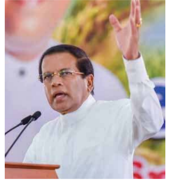
உணர்ந்துகொள்ளுங்கள் - என்றார்.

வாறு கூறினார். அவர் மேலும் தெரிவித்ததாவது:- நான் ஜனாதிபதியாகப் பதவி வகித்த காலத்தில் அறிமுகமான அமெரிக்கா, இந்தியா, சீனா உட்பட பல நாடுகளின் அரசு தலைவர்கள் தொடர்ந்தும் என்னுடன் தனிப்பட்ட ரீதியில் நட்பாக இருந்து வருகின்றனர். நான் விரும்பும் எந்த நேரத்திலும் அந்த நாடுகளின் தலைவர்களைத் தொடர்புகொள்ள முடியும் அளவுக்கு உறவு வலுவாக உள்ளது. இப்படியான பெறுமதிக்க நபரின் பெறுமதியை பொலனறுவையை சேர்ந்த சிலர் மறந்து போயுள்ளனர். எனக்கு வாக்களிக்க வேண்டாம் எனக் கூறும் நபர்கள் பொலனறுவைக்கு என்ன செய்தார்கள் என்று கேளுங்கள். ஊரைச் சேர்ந்தவனுடைய பெறுமதியை