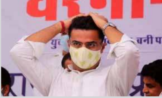
சர் பதவியில் நீடிப்பதற்கு 106 சட்டமன்ற உறுப்பினர்

இந்தியாவின் ராஜஸ்தான் மாநிலத்தின் காங்கிரஸ் அரசுக்கு எதிராகச் செயற்பட்டு வந்த அதே கட்சியைச் சேர்ந்த சச்சின் பைலட் அந்த மாநிலத்தின் காங்கிரஸ் குழுத் தலைவர் பதவியில் இருந்தும், துணை முதலமைச்சர் ஆகிய பதவிகளில் இருந்து நீக்கப்பட்டார். இரண்டாவது நாளாக நடைபெற்ற ராஜஸ்தான் மாநிலக் காங்கிரஸ் கட்சியின் சட்டமன்ற உறுப்பினர்கள் கூட்டத்திலும் சச்சின் பைலட் கலந்துகொள்ளவில்லை. இந்தக் கூட்டம் முடிவடைந்த பின்னர் அவர் துணை முதல்வர் பொறுப்பில் இருந்தும் கட்சியின் மாநிலத் தலைவர் பொறுப்பிலிருந்தும் நீக்கப்பட்டுள்ளார் என்று தெரிவிக்கப்பட்டுள்ளது. அவருக்குப் பதிலாக அசோக் கெலோத் முதலமைச்சர் பதவியில் நீடிப்பதற்கு 106 சட்டமன்ற உறுப்பினர்