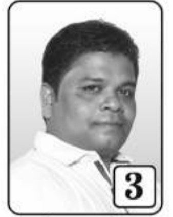
3 சீ. ஜெயதீபன் மரபியலாளர்

கூழலியலாளர் முன்னாள் விவசாய அமைச்சர் - வடமாகாணம்