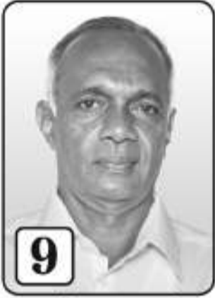
9 சண் தயாளன் ஓய்வூதியை உதவிக் கல்விப் பணியாளர்