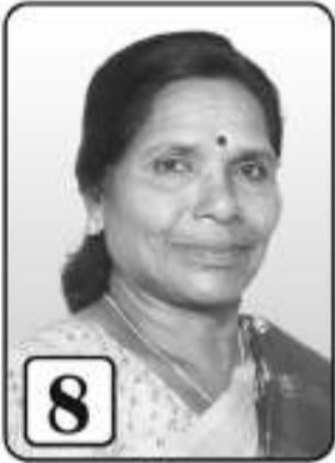
8 மலர் சின்னையா ஓய்வூதியை ஆதிபர் ஆசிரியர் கண்காணி. கோப்பாய்.