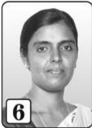
6 நிமலினி வோல்டன் கழக செயலி

அரசியலில் தமிழ்த் தேசியச் செழுமை அபிவிருத்தியில் நிலையுறான முழுமை சுற்றுச்சூழலில் காணுமிடமெல்லாம் பசுமை