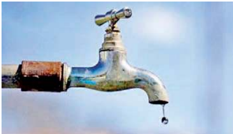
காலை 6 மணிவரை நீர்வெட்டு அமல்படுத்தப்படவுள்ளது.

கொழும்பு நீர் மற்றும் கழிவு நீர் மேலாண்மை மேம்பாட்டு முதலீட்டுத் திட்டத்தின் கீழ் திருத்தப் பணிகளை மேற்கொள்வதற்காக, கொழும்பின் பல பகுதிகளில், நாளை தினம் (18), 10 மணிக்குியால நீர்வெட்டு அமல்படுத்தப்படவுள்ளதாக, தேசிய நீர்வழங்கல் மற்றும் வடிகாலமைப்புச் சபை தெரிவித்துள்ளது. கொழும்பு 13, 14, 15 ஆகிய பகுதிகளிலேயே, நாளை (18) இரவு 8 மணிமுதல் ஞாயிற்றுக்கிழமை