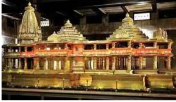
பிரதமர் மோடியின் வாரணாசி தொகுதி மற்றும் காசியை சேர்ந்த ஆன்மிக பெரியோர் பூமி பூஜையை நடத்துவார்கள் என கூறப்படுகிறது.

இந்த நிகழ்ச்சியில் கலந்து கொள்ள அன்றைய தினம் காலை 11 மணிக்கு வரும் பிரதமர் மோடி பிற்பகல் 1.10 மணி வரை அங்கு இருப்பார் எனக் கூறப்படுகிறது. 5 ஆம் திகதி காலை 8 மணிக்குத் தொடங்க உள்ள பூமி பூஜை தொடர்பான சடங்குகளில் அயோத்தியாவின் முக்கிய துறவிகள், ஸ்ரீராமர் கோயில் இயக்கம் தொடர்பான மூத்த தலைவர்கள், ஆர்.எஸ்.எஸ்., விஷ்வ இந்து பரித் அமைப்புகளின் மூத்த நிர்வாகிகள், சில மூத்த மத்திய அமைச்சர்கள், உ.பி.மாநில அமைச்சர்கள் உள்ளிட்டோர் பங்கேற்பார்கள் என சொல்லப்படுகிறது.