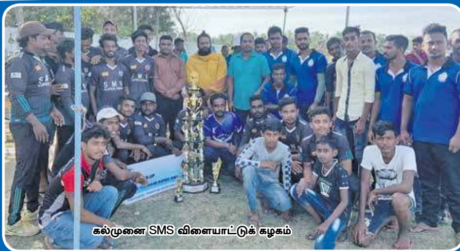
கல்முனை SMS விளையாட்டுக் கழகம்